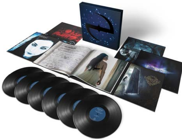
THE ULTIMATE COLLECTION

Mit den Alben Origin, Fallen, The Open Door, Evanescence und Lost Whispers auf 180g-Vinyl